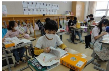
初めて国語辞典をつかいます