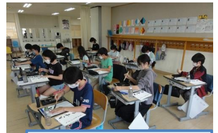
よい姿勢で書写を行います