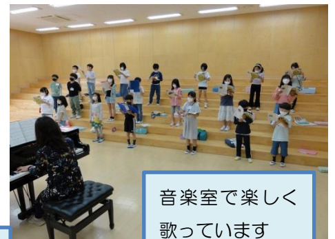
音楽室で楽しく歌っています