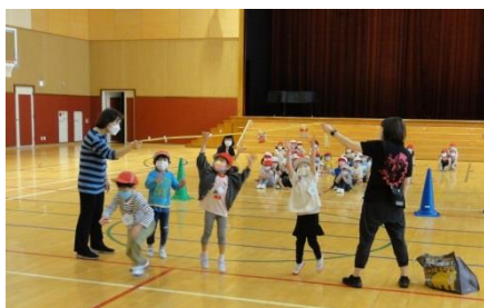
幼稚部春の遠足（校内・屋上）