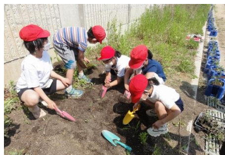
登校後、学年の植物に水やりをします